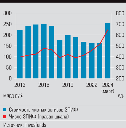
График 2 Число ЗПИФ и общая стоимость их активов в начале 2024 года внезапно резко выросли

Директор одного из ЗПИФов рассказал «Моноклю», что бизнесмены, у которых есть активы в размере 15–20 млрд рублей и более, создают собственные управляющие компании, и число таких УК в стране резко выросло. Собственники стараются сделать так, чтобы эти УК не были аффилированы с их основным бизнесом, иначе есть риск, что те подпадут под санкции. Поскольку деньги сегодня не выводятся за рубеж, все они находятся в России, и управляющие компании помогают грамотно инвестировать их.