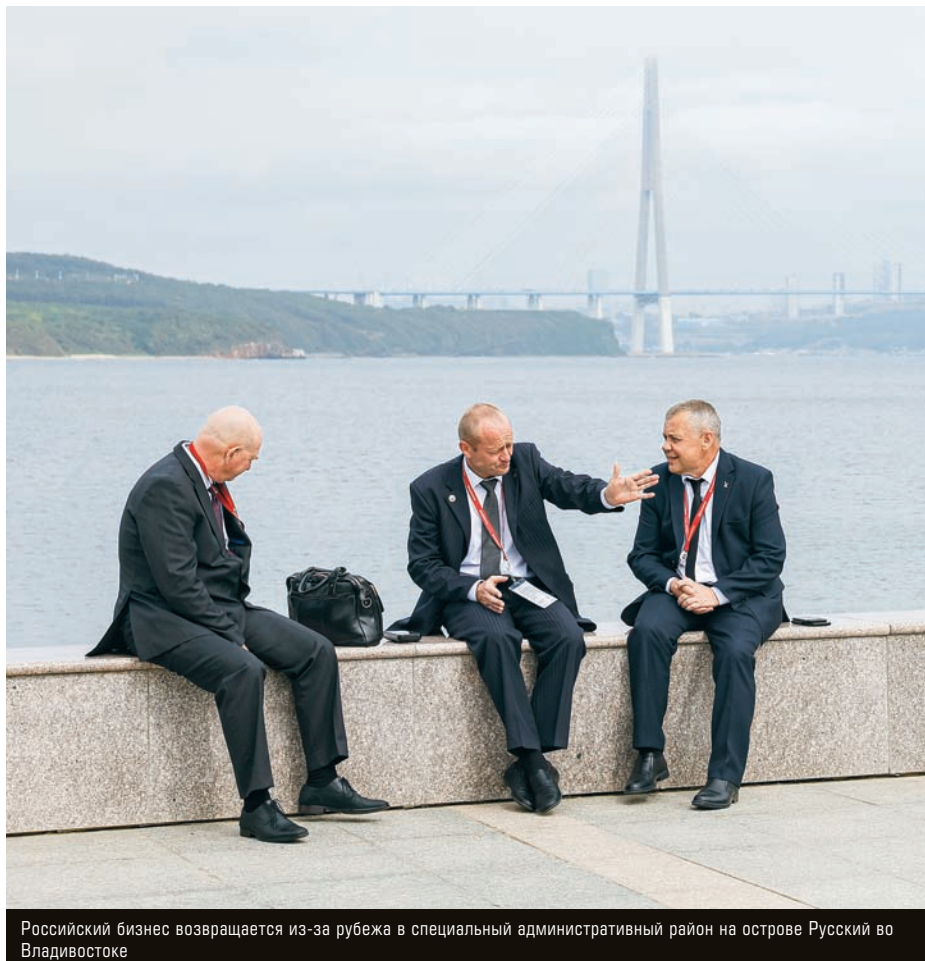
Российский бизнес возвращается из-за рубежа в специальный административный район на острове Русский во Владивостоке

жала кипрской компании, которая затем переехала в Калининградскую область. Летом прошлого года АРМ купила активы Decathlon, на основе которых запустила новую сеть Desport.